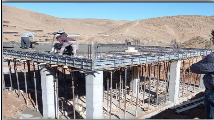
خانه بهداشت کیسلان مهاباد