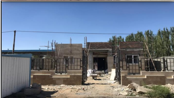
خانه بهداشت اوزون اوبا چهاربرج