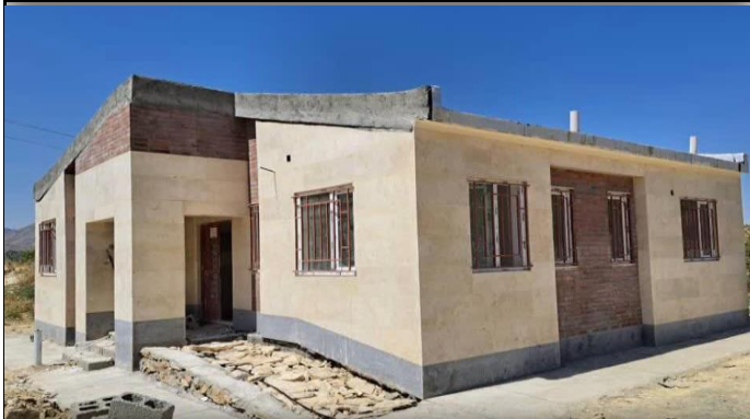
خانه بهداشت ساوان سردشت