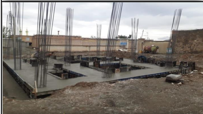
خانه بهداشت ایل بلاغی شوط