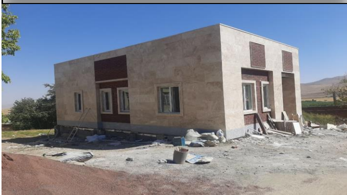
خانه بهداشت قره بلاغ مهاباد