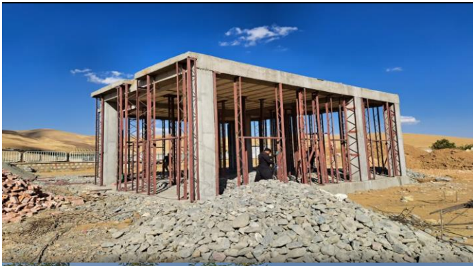
خانه بهداشت گرده سور پیرانشهر