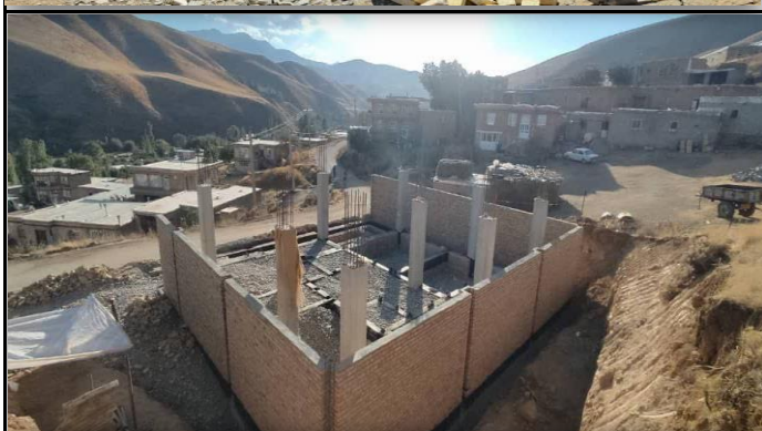
خانه بهداشت شیوه برو اشنویه