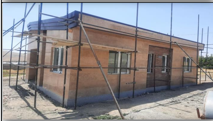
خانه بهداشت شیرکی سلماس