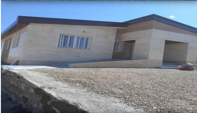
خانه بهداشت ساز آغل چالدران