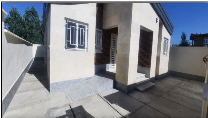
خانه بهداشت دزگیر ارومیه