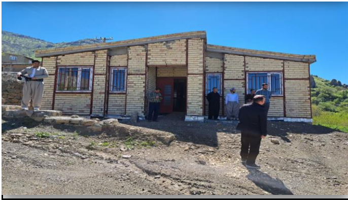
خانه بهداشت مزن آباد سردشت