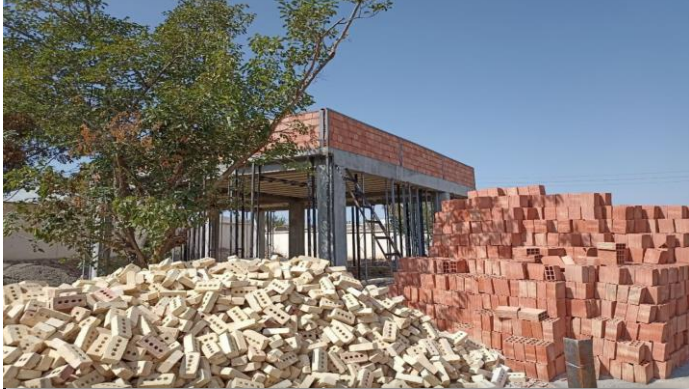
خانه بهداشت میرزا جلیل چایپاره