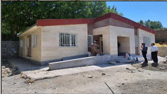
خانه بهداشت ورده سردشت