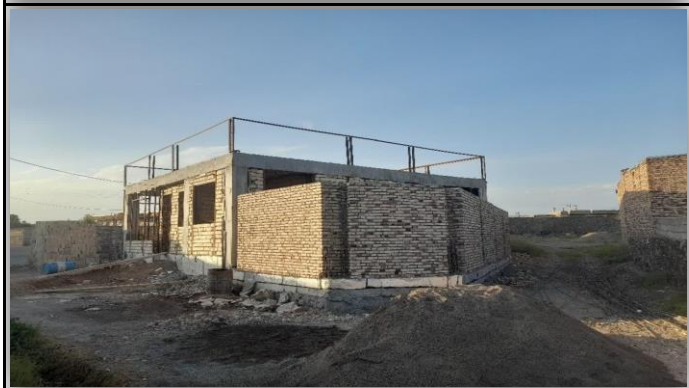
خانه بهداشت خلج کرد شوط