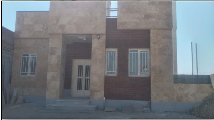
خانه بهداشت گرده گل میاندوآب