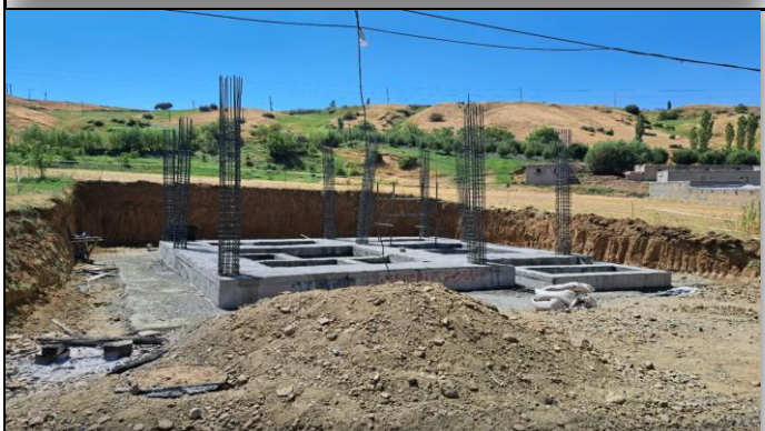
خانه بهداشت ذمه اشنویه