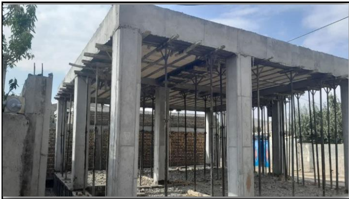
خانه بهداشت بهلول آباد ارومیه