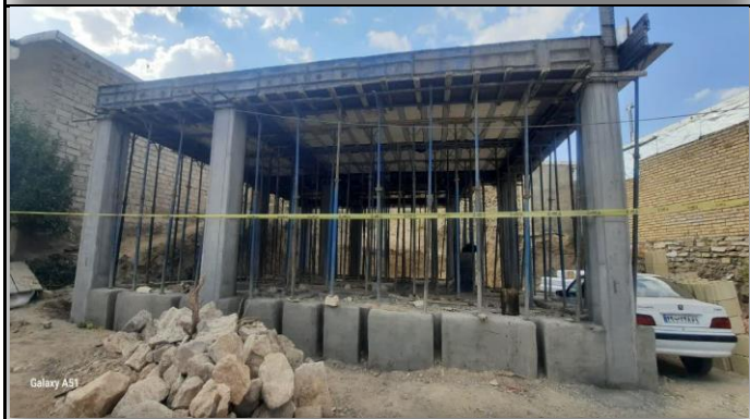
خانه بهداشت گزدره تکاب