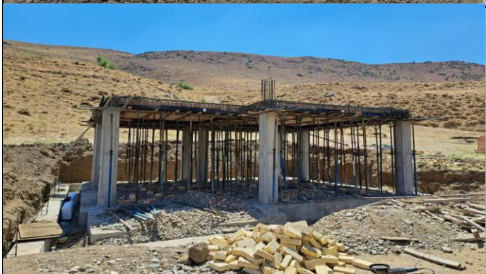
خانه بهداشت درود اشنویه