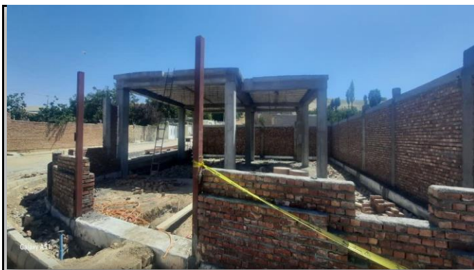
خانه بهداشت آغچه مسجد شاهین دژ