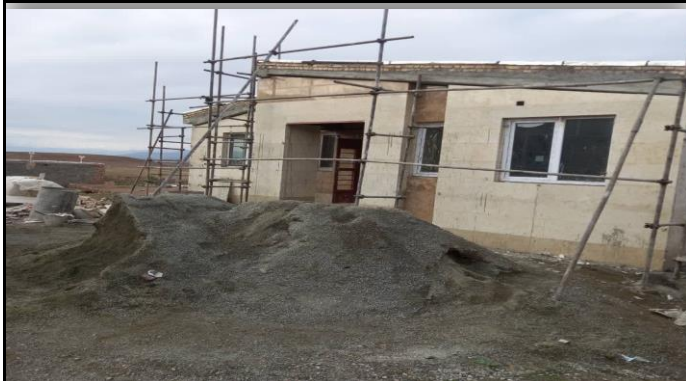
خانه بهداشت مادلو چالدران