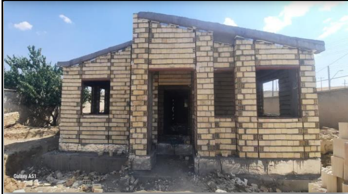
خانه بهداشت قره قیه تکاب