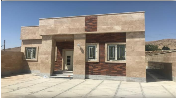
خانه بهداشت ترشکان مه‌آباد