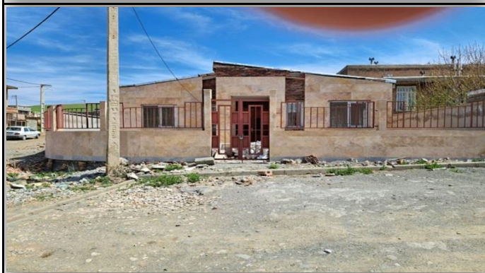
خانه بهداشت سیلوه پیرانشهر