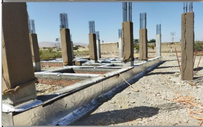
مرکز جامع سلامت روستایی بیگم قلعه نقده