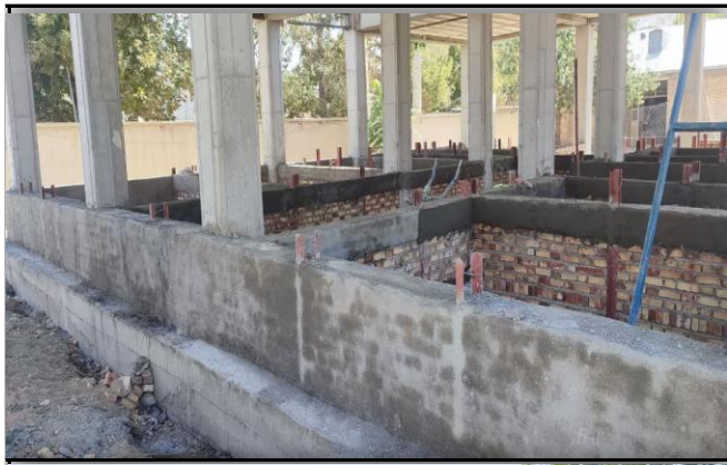
مرکز جامع سلامت روستایی کهرئز ارومیه