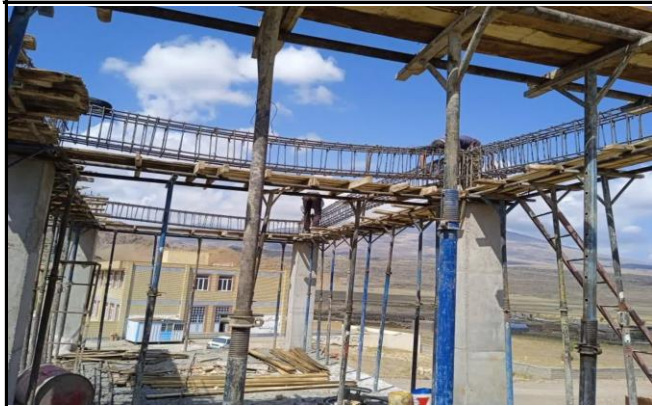
مرکز جامع سلامت روستایی گریک ماکو