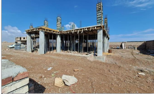
مرکز جامع سلامت روستایی قره ایاق شوط