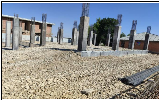
مرکز جامع سلامت روستایی حسنلو نقده