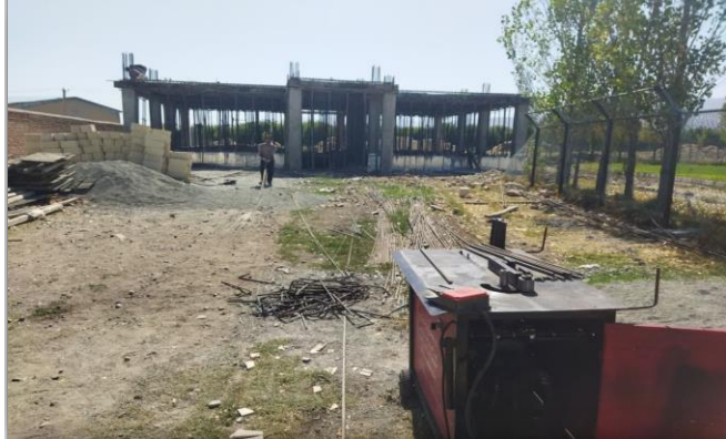
مرکز جامع سلامت روستایی چیانہ نقده