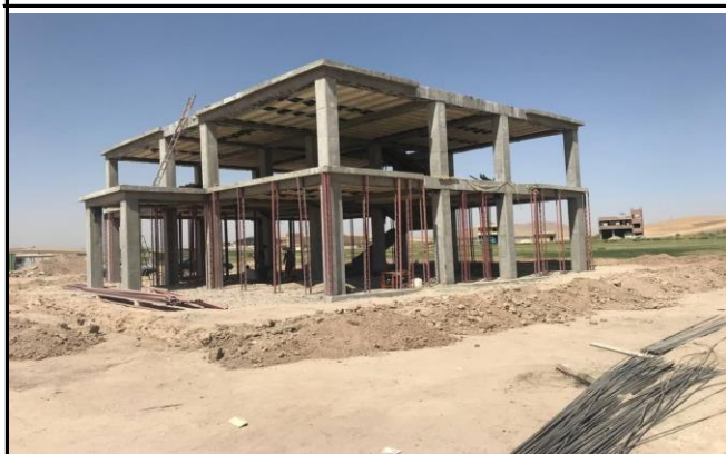
مرکز جامع سلامت روستایی گل سلیمان آباد باروق