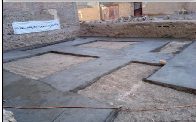
مرکز جامع سلامت روستایی کشمش تپه ماکو