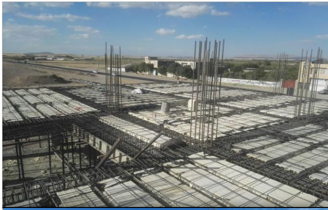
مرکز جامع سلامت روستایی چالخاماز میاندواب