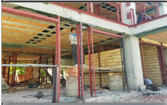
مرکز جامع سلامت روستایی راهدانه نقده